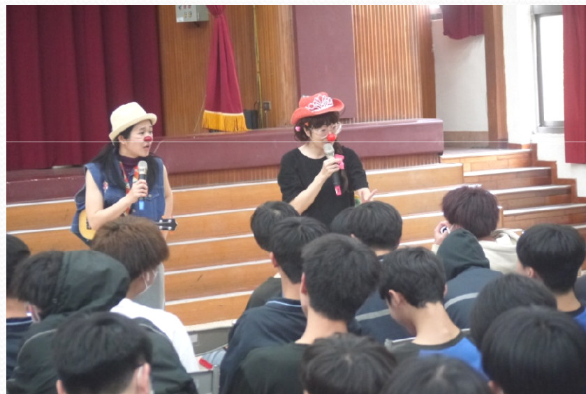
示範如何以小丑的姿態與人親近