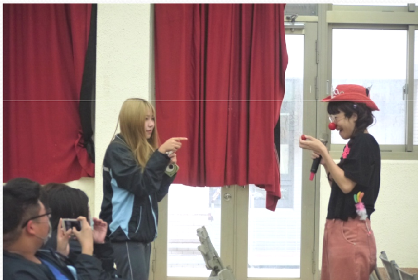
紅鼻子醫生與學生互動