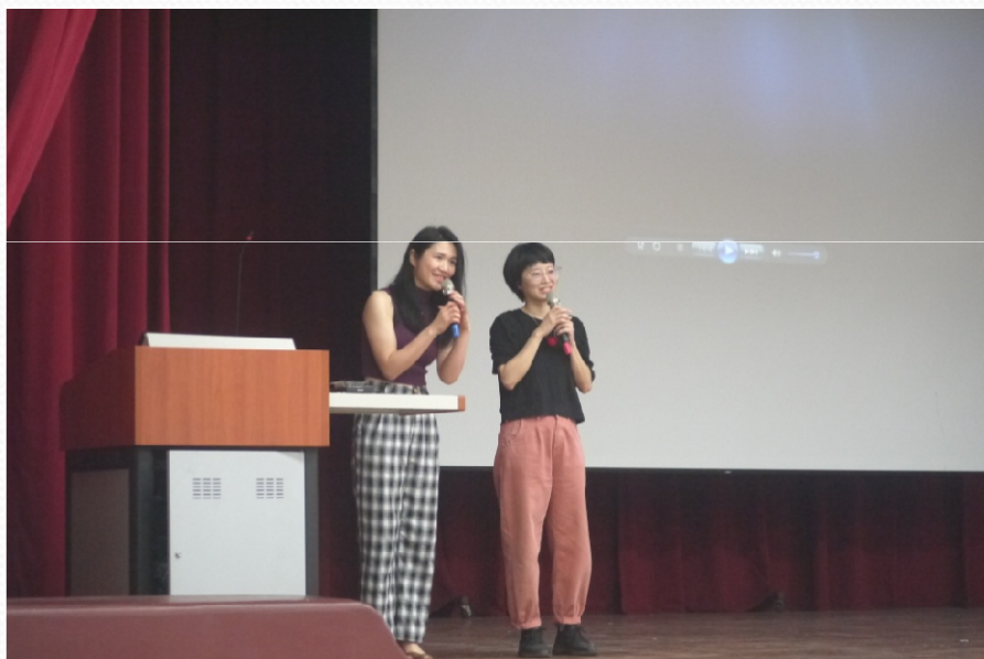
卸掉裝扮變成講師介紹