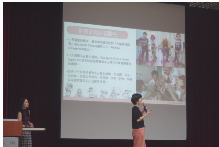
分享此工作對生命的觸動與激盪